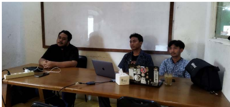
Gambar 2. Pembukaan Kegiatan Pengabdian Kepada Masyarakat

Sebelum mengikuti dan memulai kegiatan, peserta yang datang mengisi dan menandatangani daftar hadir yang telah disiapkan oleh tim pengabdian. Dilanjutkan dengan pembukaan dan sambutan oleh tim pengabdian.