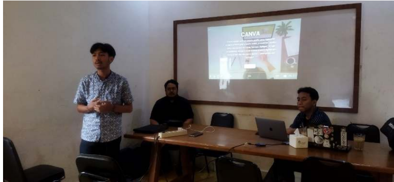
Gambar 4. Pemberian Materi

dibuat sekadarnya saja dan belum menggunakan fitur-fitur yang disediakan oleh beberapa aplikasi baik aplikasi gratis maupun aplikasi berbayar.