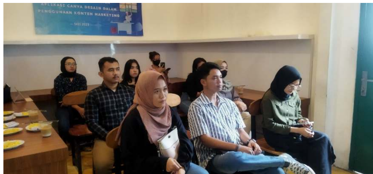
Gambar 6. Pemberian Materi