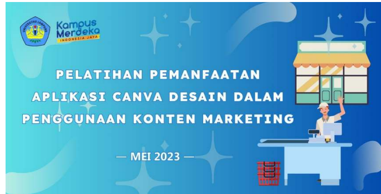
Gambar 3. Banner Kegiatan Pengabdian kepada Masyarakat

Sumber: Dokumentasi Tim Pengabdian, 2023