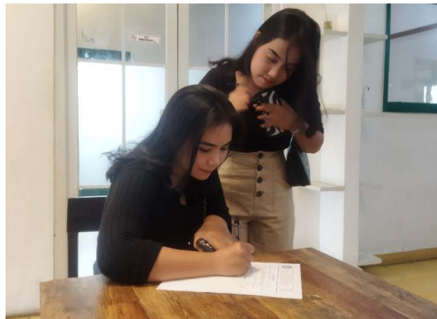
Gambar 3. Pengisian Pre Test oleh Peserta

Kegiatan Pengabdian Kepada Masyarakat dimulai dengan pengisian pre test oleh peserta. Pemberian pre test bertujuan untuk mengetahui pemahaman dasar peserta berkaitan dengan pemanfaatan aplikasi Canva Desain dalam pembuatan konten marketing.