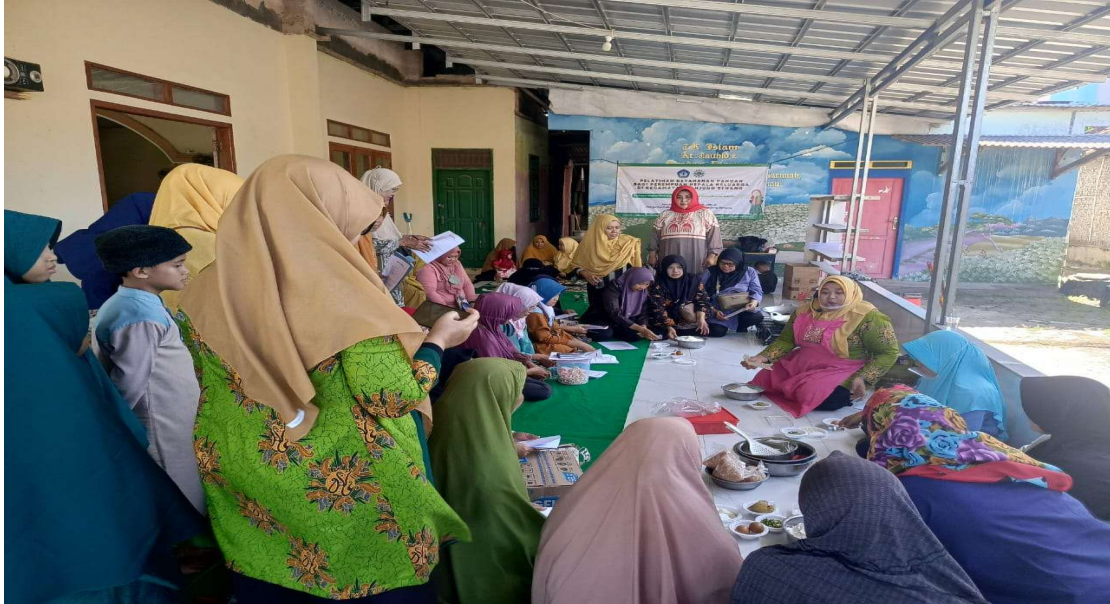
Gambar 3. Kegiatan evaluasi