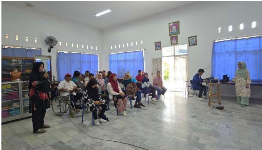
Gambar 2. Peserta tuna netra memberikan pertanyaan

Beberapa peserta berbagi pengalaman saat menggunakan hak pilihnya dalam pemilu 2024 yang lalu. Mereka bercerita tentang pengalaman pindah mata pilih, diberi tawaran menjadi anggota KPPS, ada keluarga disabilitas yang tidak terdata sebagai pemilih, kendala yang dihadapi saat pergi ke TPS, dan sebagainya.