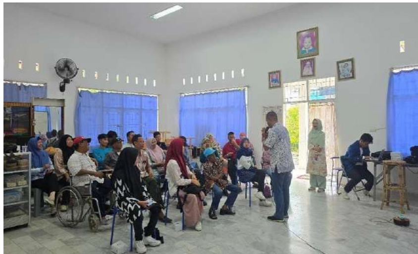
Gambar 4. Penyampaian materi

Kegiatan pengabdian disusun berdasarkan pokok-pokok materi yang relevan dan dikemas dalam bentuk penyampaian materi dan diskusi. Materi yang disampaikan mengenai hak pilih penyandang disabilitas dan mekanisme perlindungan hak pilih dalam pemilu. (Materi terlampir). Sebelum materi disampaikan, dilakukan tes awal ( pre-test ) terkait materi-materi yang akan disampaikan untuk melihat sejauh mana pemahaman yang dimiliki para peserta sebelum kegiatan dilaksanakan. Setelah semua materi disampaikan diakhir pelatihan dilakukan tes akhir ( post-test ) untuk mengukur pemahaman peserta mengenai materi diberikan.