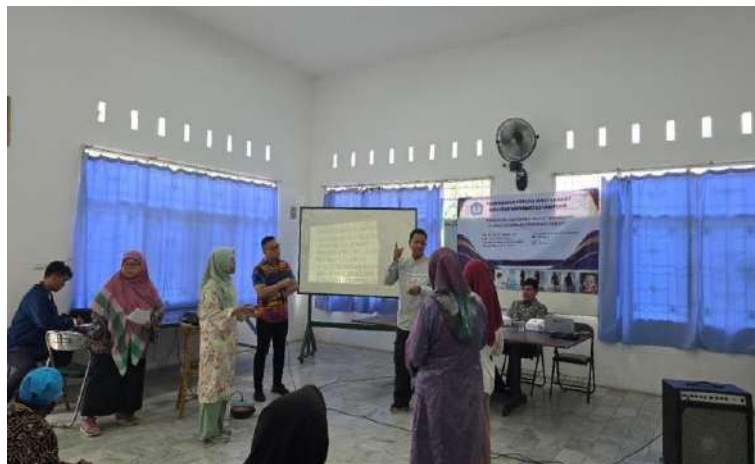
Gambar 8. Peserta Tuli Menjelaskan dengan Bahasa Isyarat