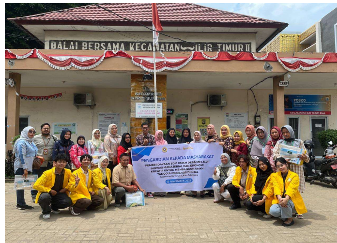
Gambar 2. Dokumentasi Kegiatan Pengabdian dan Pemberdayaan UMKM

Hasil implementasi menunjukkan bahwa pelaku usaha memberikan respons positif terhadap penggunaan teknologi tepat guna karena dianggap mampu meningkatkan kualitas produk tanpa memerlukan investasi yang terlalu besar. Selain itu, penggunaan alat tersebut juga membantu meningkatkan profesionalisme usaha dalam menghadapi persaingan pasar yang semakin ketat.