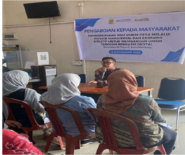
Gambar 1. Penyampaian Materi Literasi Digital kepada Pelaku UMKM Sumber: Dokumentasi tim pengabdian, 2025.

Hasil pelatihan menunjukkan adanya peningkatan pemahaman peserta mengenai pemanfaatan media digital dalam pengembangan usaha. Beberapa peserta mulai mampu membuat katalog produk sederhana, mengoptimalkan penggunaan media sosial untuk promosi, serta memanfaatkan fitur bisnis yang tersedia pada platform digital (Hadjri et al, 2025).