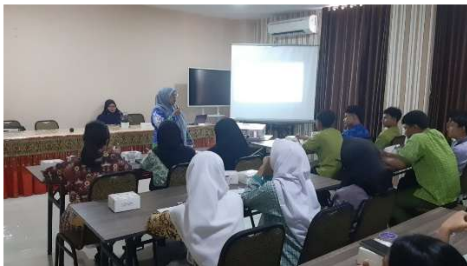
Gambar 1. Pelaksanaan kegiatan

Pelaksanaan kegiatan pengabdian ini dilakukan melalui tiga tahapan utama, yaitu analisis situasi, intervensi objek, serta evaluasi dan refleksi. Tahap analisis situasi dilakukan berdasarkan hasil studi lapangan pendahuluan (pra-riset) yang telah dilaksanakan oleh tim pengabdian pada bulan Mei 2025. Selain itu, penelusuran berbagai data sekunder juga dilakukan untuk memperkuat asumsi utama kegiatan, yaitu pentingnya penyelenggaraan program yang dapat membekali siswa/i SMKN 4 Bandar Lampung dengan pengetahuan dan keterampilan yang mendukung kesiapan mereka dalam memasuki serta bersaing di dunia kerja setelah lulus.