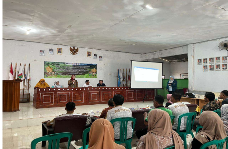
Gambar 2. Pemaparan Narasumber

kelancaran pelaksanaan program. Koordinasi melibatkan Dinas Pariwisata Kabupaten Pesawaran, Pemerintah Desa Sungai Langka, pengelola destinasi wisata, tokoh masyarakat, tokoh pemuda, serta Kelompok Wanita Tani (KWT). Keterlibatan berbagai aktor tersebut menjadi bagian penting dalam membangun kolaborasi dan memperkuat partisipasi masyarakat dalam upaya pengembangan desa wisata berbasis prinsip keberlanjutan.