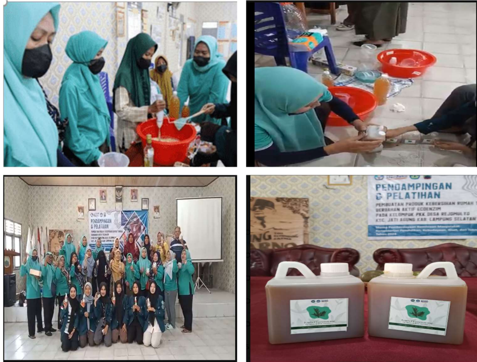
Gambar 2. Kegiatan pelatihan pembuatan karbol alami berbasis ekoenzim